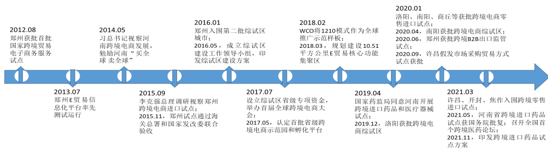
图1 河南省跨境电商发展历程